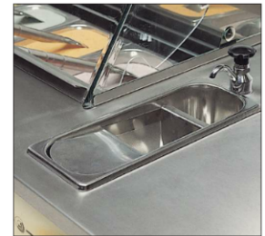
Incorpora lavaporcionador con grifo en la parte superior del carro.