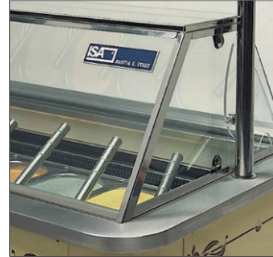
Sobreestructura en cristal con cierre hermético.