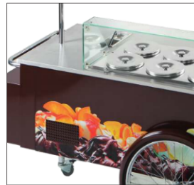
Sistema "poceto" bajo petición. Consulte con su comercial.