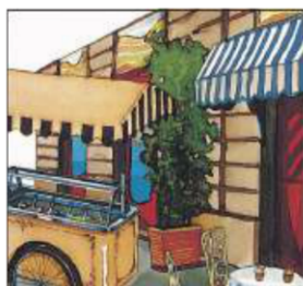
Servicio al aire libre.