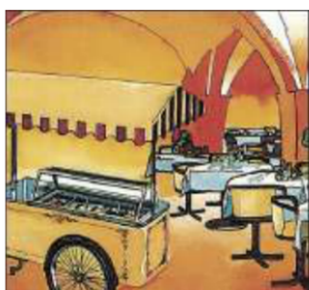
Servicio al restaurante.