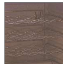
Estante metálico regulable en altura.